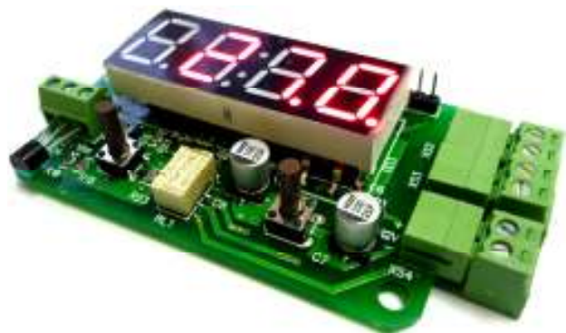
Рис. 1 Общий вид устройства.

Предлагаемый блок в собранном виде позволяет реализовать принцип: купил – подключил. Блок позволит радиолюбителю получить простой и надежный цифровой термостат с возможностью измерения и контроля температуры в диапазоне -55°С до +125°С. Устройство будет полезно для применения в быту, дома, на даче, бане или погребе. С его помощью можно производить измерения температуры окружающей среды, контролировать и регулировать рабочую температуру электрических котлов, теплого пола, теплиц, холодильных установок или морозильных камер. Устройство запоминает настройки гистерезиса при отключении питания.