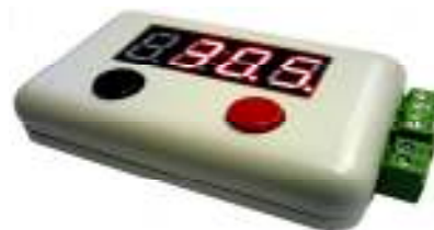
Рис. 4 Вариант оформления устройства.

Подключение реле TR91F-220VAC-SC-A на 220В, для управления мощной нагрузкой до 8 кВт (реле приобретается отдельно)