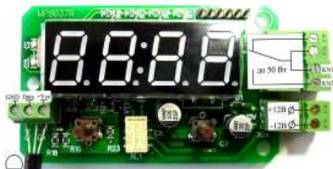
Рис. 2 Назначение разъемов.

что приводит к завышенным показаниям. Поэтому для точных показаний термостата, необходимо вынести термодатчик за пределы корпуса устройства.