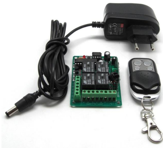
Рис.1 Общий вид устройства.

DIY-комплект для дистанционного управления различным электрооборудованием с помощью брелка-передатчика на радиочастоте 433 МГц по 4-м независимым каналам, с помощью электромагнитных реле.