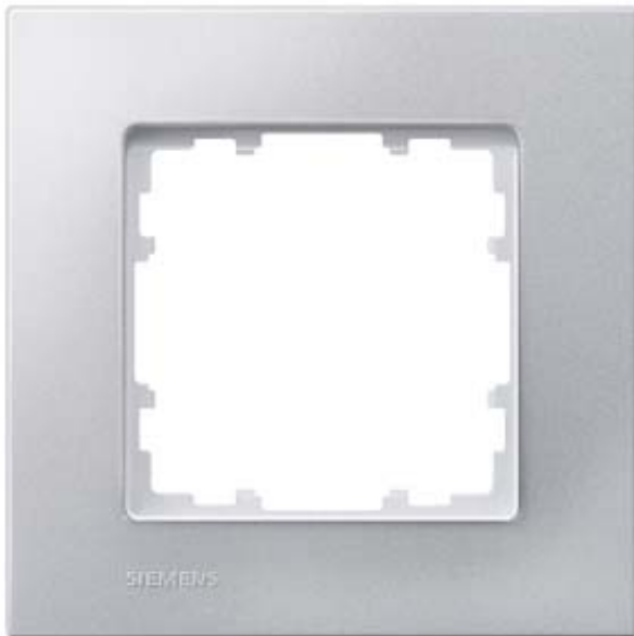
DELTA MIRO FRAME 1-FOLD COLOUR ALUMINIUM METALLIC DIMENSIONS 90X90MM